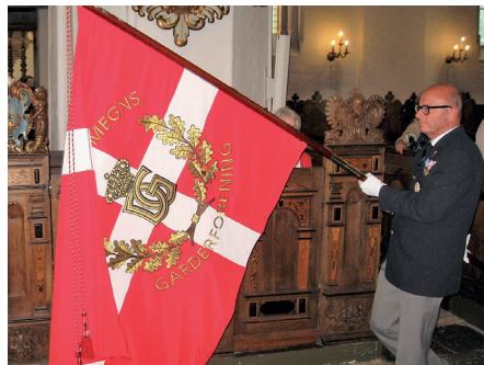
☐ Køge GF: Fanen i Køge Kirke under Valdemarsdag 2018