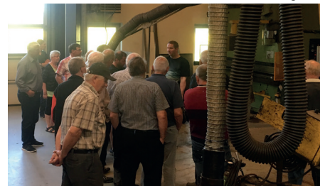
Viborg GF: Virksomhedsbesøg med Randers GF på Hammershøj Smede og Maskinfabrik.