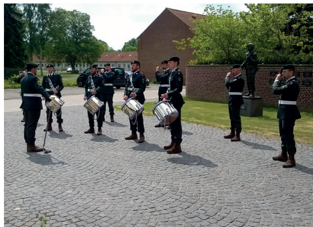
Tambourkorpset spiller ved mindemonumentet.

soldaterne læste mindeord, der blev lagt en krans og en trompetist fra Den Kongelige Livgardes Musikkorps spillede "Danmarks sidste Honnør".