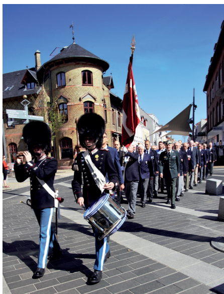
Vendsyssel GF: March i gaderne i forbindelse med foreningens 100 års jubilæum.