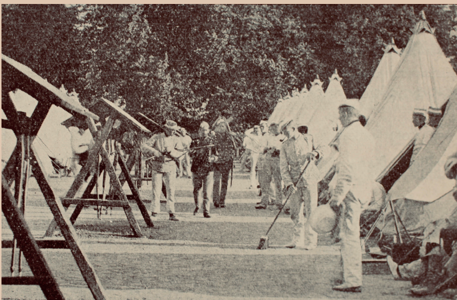
En Garders daglige Liv. I Lejrgaden paa Jægersborg.

Ovenstaaende er tilsendt Garderbladet fra 231/3 1893 C. K. Jensen, Bandoeng, Java, og viser hvorledes en Redaktør i Bandoeng kan tage Fejl af Landene i Meddelelserne i sit Blad. – Det skal selvfølgelig være Wiborg i Finland.