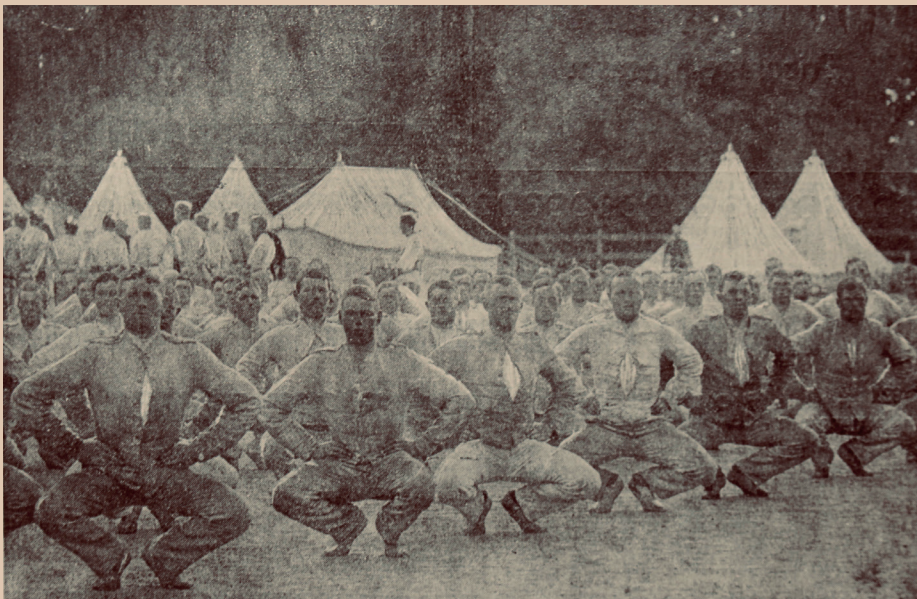
En Garders daglige Liv. Gymnastik.