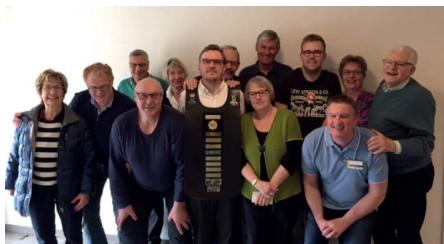
Silkeborg GF: Fugleskydning genoptaget efter 3 års fravær.