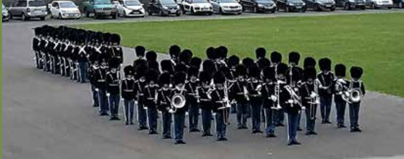
Paraden klar til afgang på Eksercérpladsen.