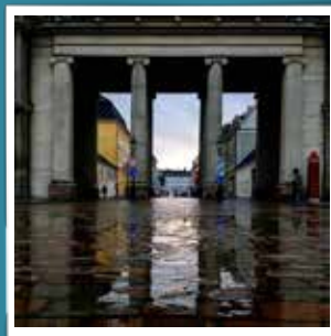
@goldenlion_dk The Colonnade at Amalienborg... #amalienborg#amalienborgpalace #livgarden #garderliv