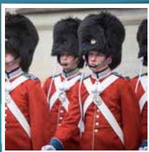
@obh_foto Red galla uniform, at New Year's Day #garderliv #amalienborg #amalienborgpalace @militaerfoto