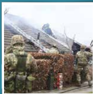
@denkongeligelivgarde Gruppe fra 2. Kompagni/III bataljon hjalp brandvæsenet med at redde værdier ud af et brændende hus. #proregeetgrege #garderliv