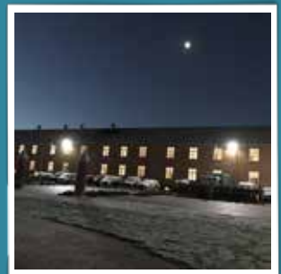
@denkongeligelivgarde En råkold januar morgen #royallifeguards #denkongeligelivgarde #enganggarderaltidgarder #proregeetgrege #garderliv