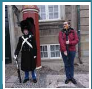
@mr.kromann Var lige en tur på Amalienborg for at inspicere garderne. #denkongeligelivgarde #amalienborg #garderliv #amalienborgpalace