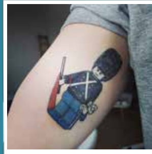
@benjaminmolsing Et evigt minde fra tiden i Den Kongelige Livgarde! #livgarden #garderliv #lego