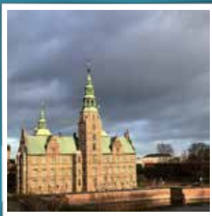
@garderliv Det er ikke dumt at bo i en køjeseng, når man har Københavns flotteste udsigt #garderliv