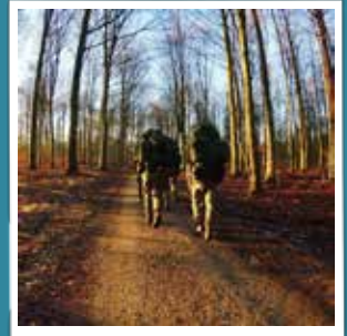
@m_sauerlange Lost somewhere in the right direction #livgarden #garderliv #onestepcloser