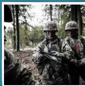
@carlhoumoller Sultne rekrutter under Rex har læst forkert på kortet, og er gået 100-150m for langt til et 'mad-drop' @militaerfoto #rex #rextur #garder #garderliv