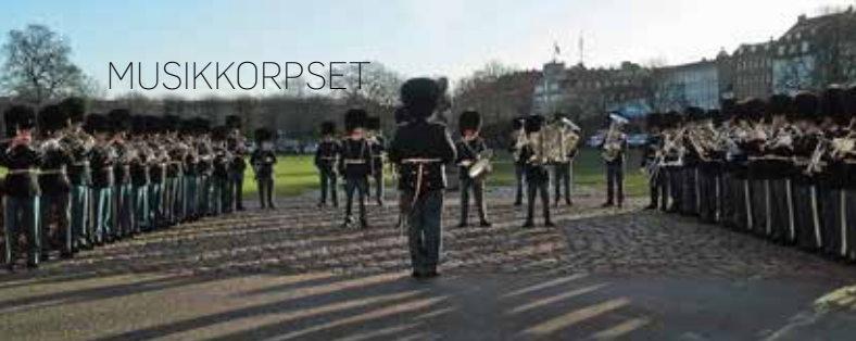
Musikkorpset indøver "Tre numre" foran Midterpavillonen.