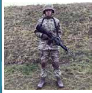
@julian.falk Pew Pew #garderliv #denkongeligelivgarde