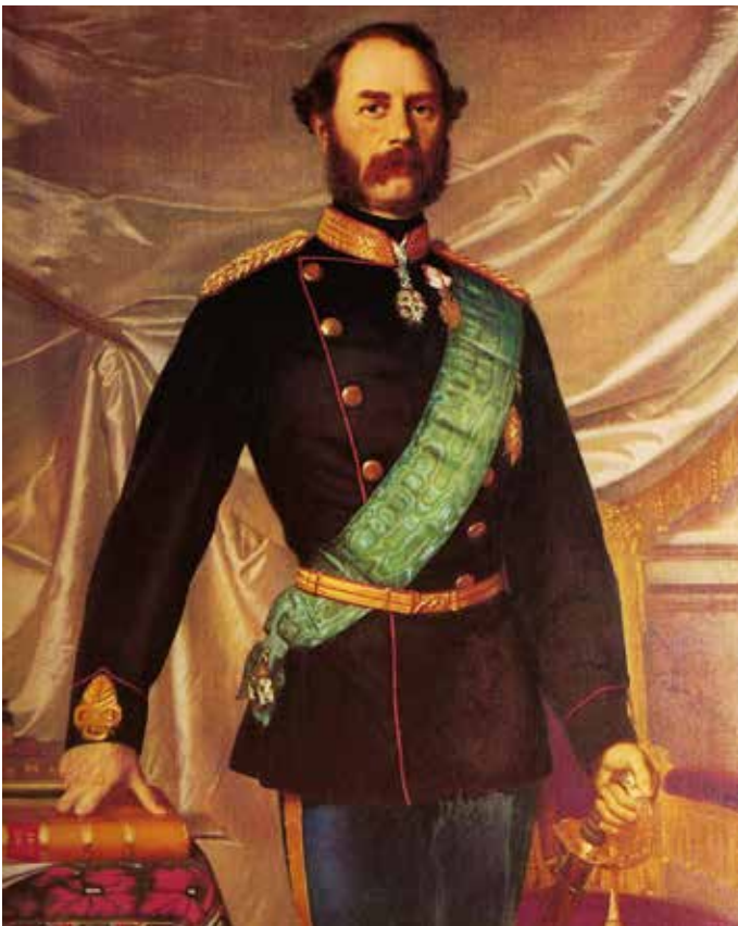
Portræt af Christian 9. af Ole Henrik Benedictus Olrik

Imens sad den Preussiske konge Wilhelm 1. og hans Kansler Otto von Bismarck i Berlin og drømte om et forenet tysk stortrige, et rige bestående af alle de tysktalende områder med Preussen som den politisk dominerende kraft. For at drømmen kunne realiseres, krævede det en preussisk annekstion af de tysktalende områder i Danmark og Frankrig.