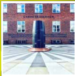
@bycarstenfrid Tilbage i trøjen #livgarden #denmark #forsvaret#garderliv