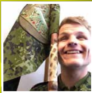
@thomasgk_ Bedste deling i felten - 1. deling #denkongeligelivgarde #semperprimus #garderliv