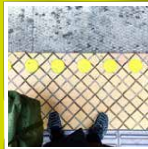
@bycarstenfrid Afrådt #København #garderliv #livgarden #denmark #forsvaret #weekend