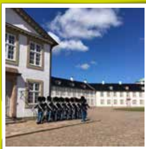
@denkongeligelivgarde Vagtskifte på Fredensborg Slot #fredensborgslot #garderliv #værdatkæmpefor #prøregeetgrege #enganggarderaltidgarder #denkongeligelivgarde #royallifeguards