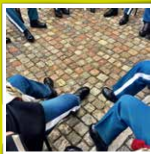
@livgardens.tambourkorps Pause-kreds #livgardenstambourkorps #livgarden #bjørnebanden #garderliv