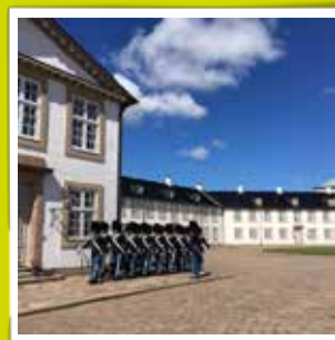
@casperdesvil Today I threw off the Official Opening of "Gardersalen" with no else than 35 of my old comrades from the military. It was so much fun having them up there for the first time and they loved it. I'm proud and happy that 4 months of meetings and work has payed off. #garderliv #palermo