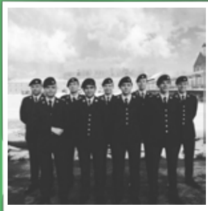
rasmus_lykkegaard96 Så er rexturen igang! #armylife #danisharmy #royallifeguards #garderliv #vandpassage #coldassfuck