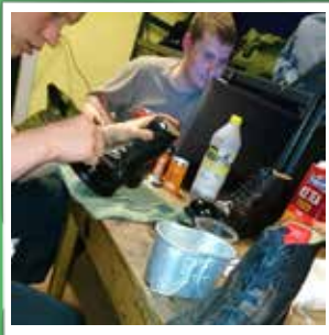
@simonhallengreen #garderliv #livgarden #livgardenskaserne #puds #klargøring