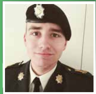
@undercovertraktor Efter at have klaret mig igennem REX-turen, kan jeg nu endelig kalde mig selv for gardes #livgarden #garderliv #proregeetgrege #denkongeligelivgarde