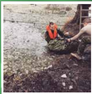
@erlingojeda Officially earned the title of Royal Guard for the royal family in the Kingdom of Denmark! #garderliv #royalguard #monarchy #denkongeligelivgarde #livgarden #military #rex #rextur