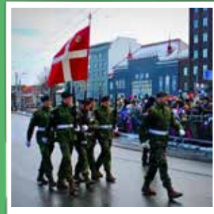
@madsdeluxe En kæmpe fornøjelse, at repræsentere Danmark ved Estlands nationaldag! #garderliv #elitenaf-danskungdom