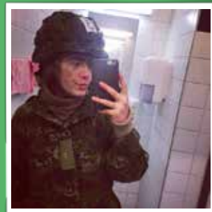
@that_danishgirl Så er Sergent Aspirant turen vel overstået. Er tilfreds over min præstation men er også helt udmattet #garderliv #soldier #danishroyalguard #denkongeligelivgarde #danmark