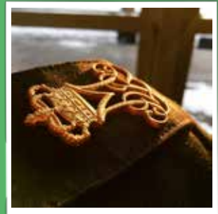
@frederik_vigen En gang garder altid gardes #garderliv #livgarden