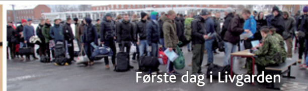
Første dag i Livgarden