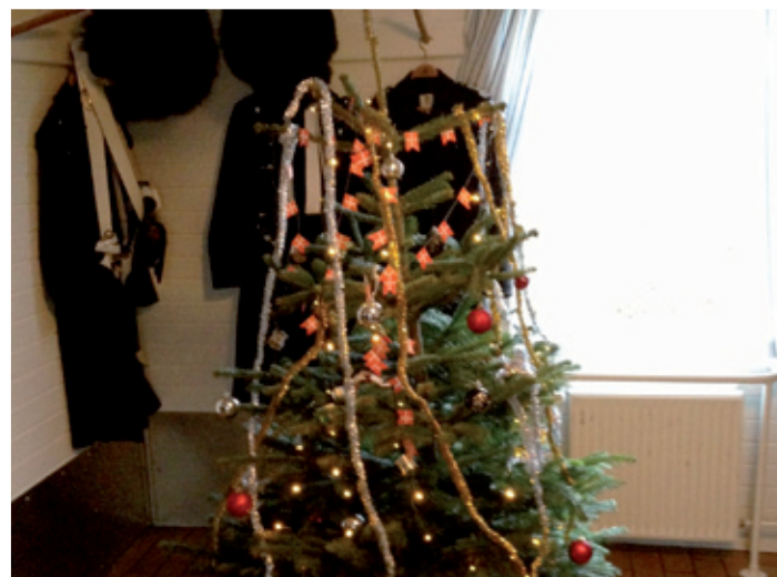
Der var også sat juletræ op i vagtstuen og på gardergården.

Julevagten var noget specielt for alle os gardere, som var været så heldige at få vagten. Selvom julen blev fejret uden familien, betød det ikke at vi holdt jul uden julemad og julegaver. Vi var så privilegerede at få alt hvad julebordet normalt består af, herunder både and, flæskesteg, medister, brunede kartofler og ikke mindst ris a la mande, naturligvis med en mandelgave. Ej at forglemme fik vi tilmed serveret nisseøl til julemaden. Ikke nok med den fine forkælelse i form af de mange flotte gaver og den gode julemad, så var der også sat juletræ op i vagtstuen samt på gardergården. Vi gardere på 3. vagthold formåede altså, trods vagten, at fejre jul på en for os alle ny og ikke mindst mindeværdig måde, men dog alligevel med mange af de traditioner vi havde med hjemmefra. Fælles for os alle var, at d. 24. december på Marselisborg slot var en rigtig god og uforglemmelig oplevelse, som ingen af os ville have været foruden.