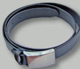
DG 8022. Sort læderbælte m. stålspænde og for- gyldt DG-embem.