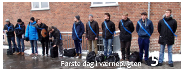
Første dag i værnepligten