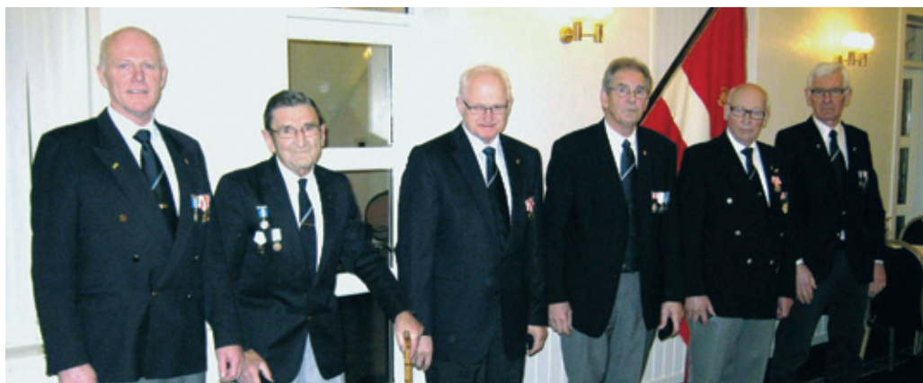
Jubilarer fra Himmerlands Garderforening.