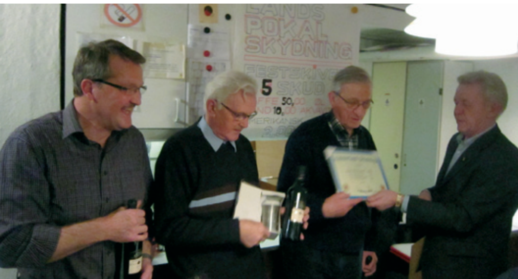
Fra årets Himmerlandsskydning en skydning mellem alle GF hjemmehørende i Himmerland.