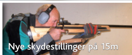
Nye skydestillinger på 15m