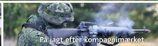
På jagt efter kompagnimærket