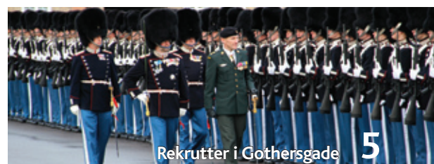
Rekrutter i Gothersgade