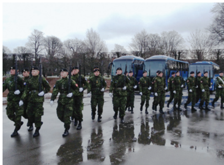
En mere kompleks del af kursets indhold er opmarchen, derfor er dette en af de ting der lægges lidt mere tyngde ved.