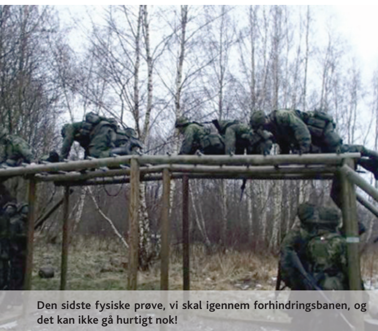
Den sidste fysiske prøve, vi skal igennem forhinderingsbanen, og det kan ikke gå hurtigt nok!

For mange blev det en sen aften, men fælles for de fleste var en behagelig følelse - feltøvelse 2 var slut og det grønne kompagnimærke kunne sættes på kampuniformen.