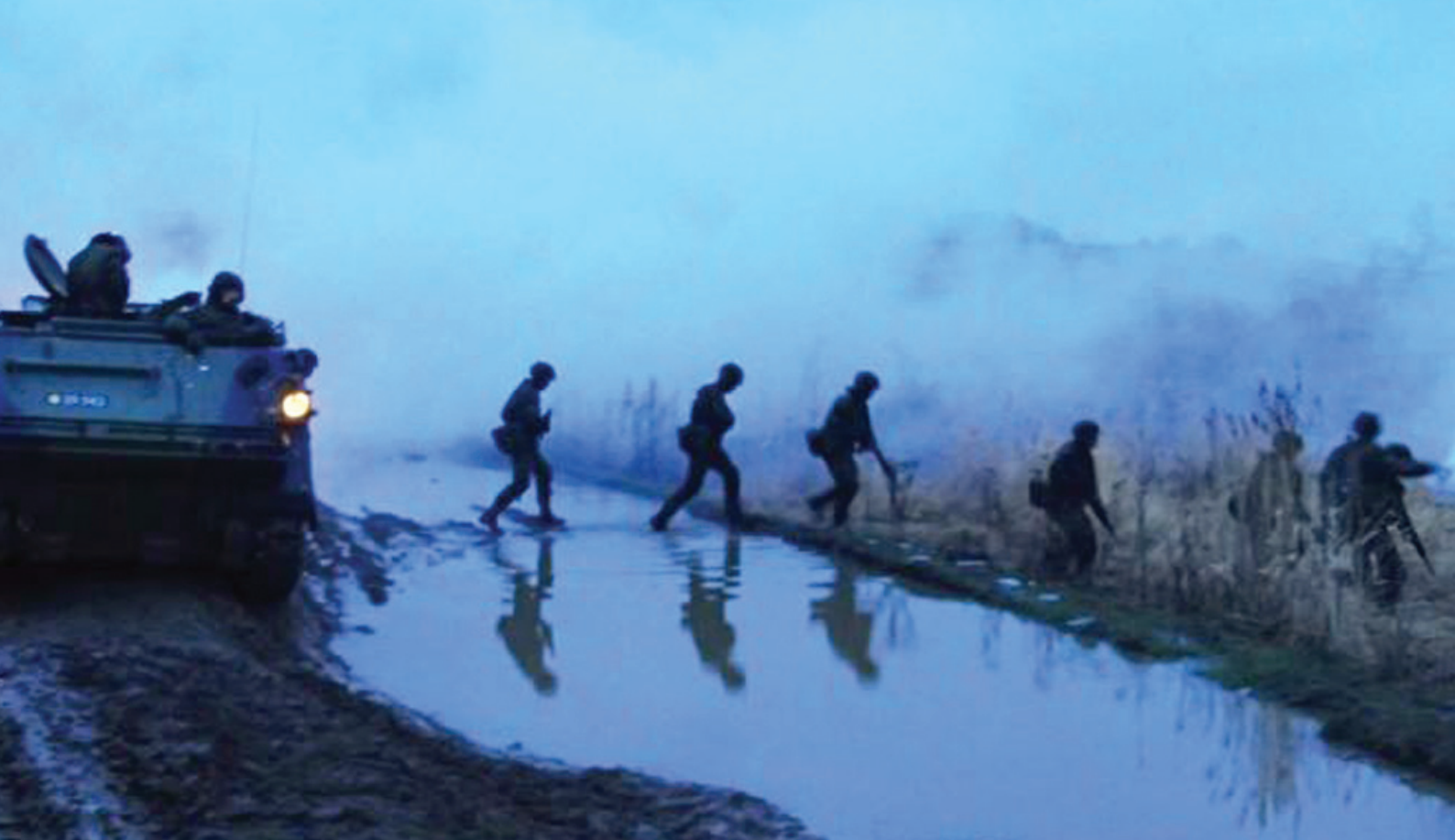
Det påmonterede tunge maskingevær åbner ild og gør alle klar til indsættelse. Rampen åbnes og 12 rekrutter vælter ud.

Som en indledende orientering fra kaptajnen fik kompagniet tildelt feltkompagnimærket (det grønne kompagnimærke), med beskeden om, at hvis ikke vi kom igennem dagen, kunne vi jo passende aflevere det tilbage, når vi ankom til Høvelte kaserne.