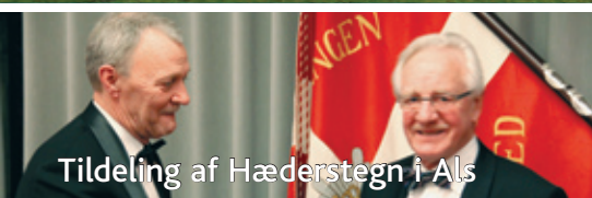
Tildeling af Hæderstegn i Als