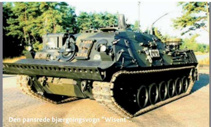
Den pansrede bjærgningsvogn "Wisent".