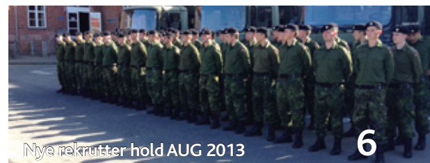
Nye rekrutter hold AUG 2013