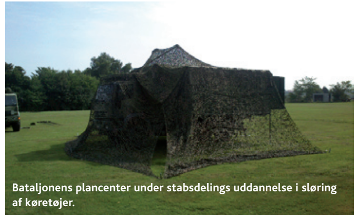
Bataljonens plancenter under stabsdelings uddannelse i sløring af køretøjer.

Stabsdelingen opstiller i felten bataljonens primære kommandostation samt bataljonschefens fremskudte kommandostation. Organisatorisk omfatter dette 21 befalingsmænd og konstabler. Fra kommandostationen udgives alle rutinemæssige ordrer, og der føres en kontinuerlig opdatering af situationen i bataljonens område samt situationen ved alle bataljonens enheder. På kommandostationen gennemføres planlægning, forberedelse af ordrer og befalinger samt kontrol af disses udførelse, fortrinsvis i forbindelse med forestående operationer.