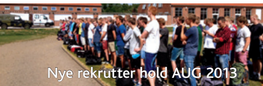
Nye rekrutter hold AUG 2013