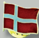
JEF 532. DK-pin forgyldt.