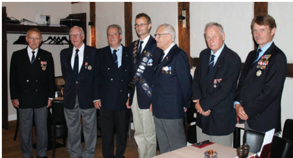
Dagens vindere med formanden i midten.