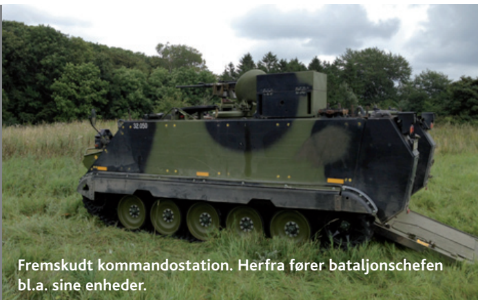
Fremskudt kommandostation. Herfra fører bataljonschefen bl.a. sine enheder.

Forsyningssektionen/Stabskompagniet/II Bataljon/Livgarden (FSSEK STKMP/II/LG) består p.t. af en oversergent med stillingsbetegnelsen forsyningsbefalingsmand (FSBM), ydermere har han en forsyningshjælper (FSHJ) med graden overkonstabel af 1. grad (OKS-1).