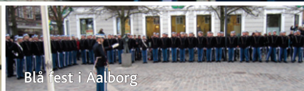
Blå fest i Aalborg