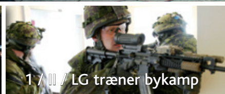
1 / III / LG træner bykamp