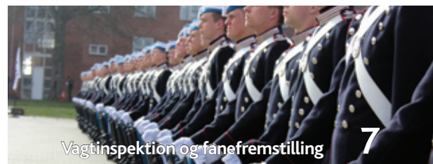
Vagtinspektion og fanefremstilling