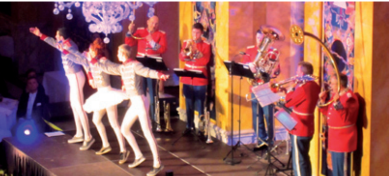
Big City Brains dansede til Messingensemblets toner.