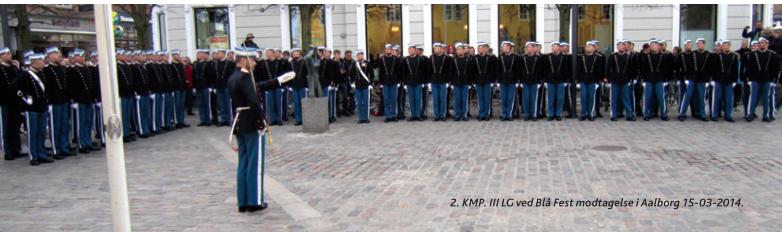
2. KMP. III LG ved Blå Fest modtagelse i Aalborg 15-03-2014.