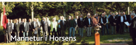
Mannetur i Horsens