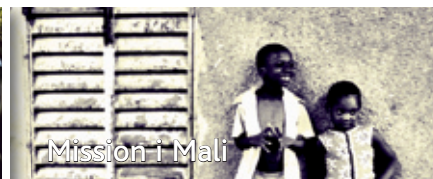
Mission i Mali