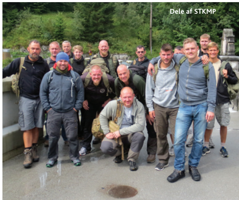
Dele af STKMP

Bussen emmer af udmattelse og trætte kroppe, men uanset hvor man kigger hen, er humøret højt og folk er glade over turens strabadser.