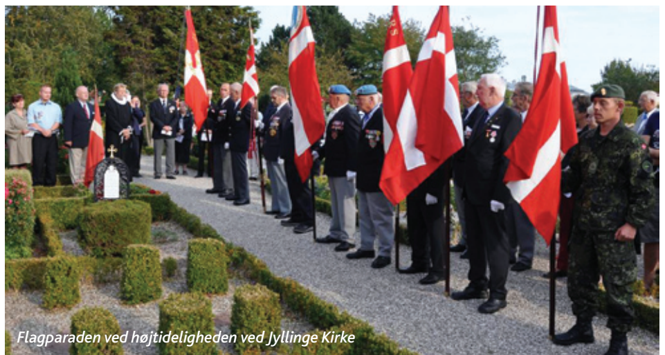
Flagparaden ved højtideligheden ved Jyllinge Kirke