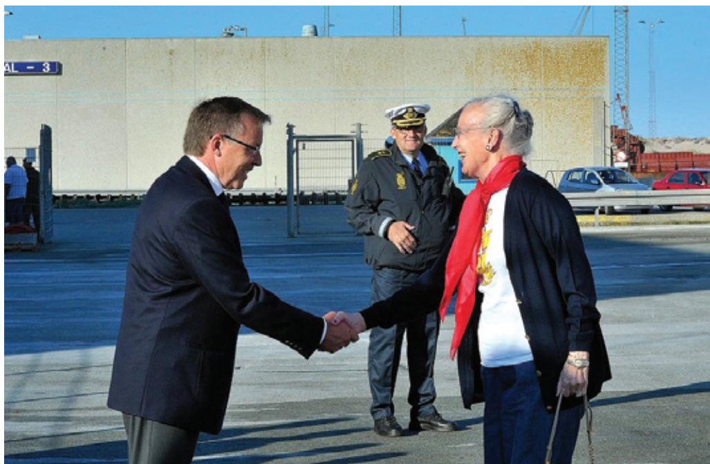
Formanden byder HM Dronning Margrethe d. II velkommen til Hanstholm.

Onsdag d. 3. september var 15 morgenfriske medlemmer med fanen, mødt op på havnen i Hanstholm for at være klar ved Kongeskibets