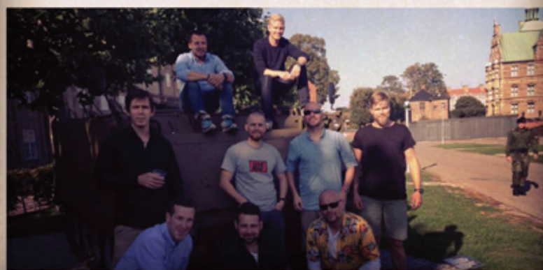
3 gruppe 1 deling then and now