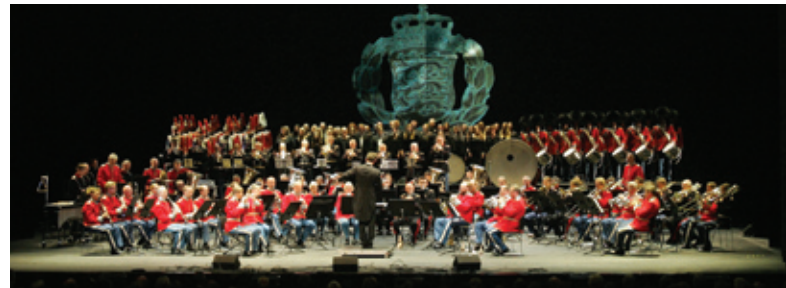
Den store finale for alle medvirkende med bl.a. Den Danske Hærs Honnørmarch af Flemming Neergaard Petersen.