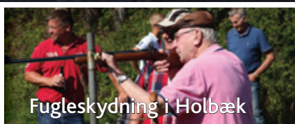
Fugleskydning i Holbæk