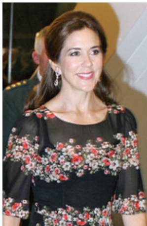
Kronprinsessen ankommer til Operaen

Der bliver taget mange billeder af Musikkorpsset både på gaden og til koncerter. Musikkorpsset vil være lykkelige for at få nogle af disse private fotos og for at få lov at bruge dem fx til historisk dokumentation, hjemmeside el. lign. Det ville glæde os at modtage dine private pletskud på mailadressen: billederafmusikkorpsset@gmail.com På forhånd 1000 tak!