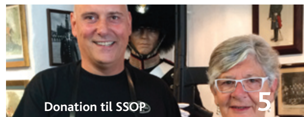
Donation til SSOP