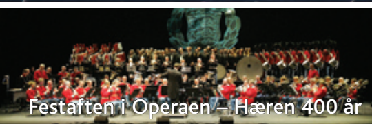
Feststften i Operaen – Hæren 400 år