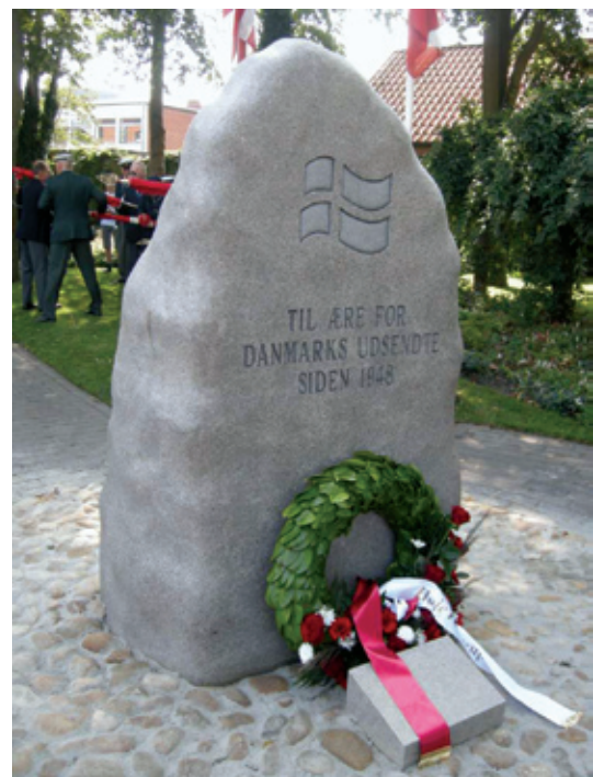
Tekst til billede: Den nye æressten afsløret i Magdas Park, Taastrup

I et samarbejde mellem Høje-Taastrup Kommune og Høje Taastrup og Omegns Garderforening samt en lokal repræsentant fra veteran-