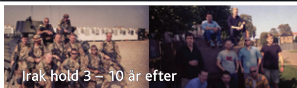
Irak hold 3 – 10 år efter