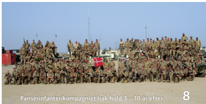
Panserinfanterikompagniet Irak hold 3 – 10 år efter