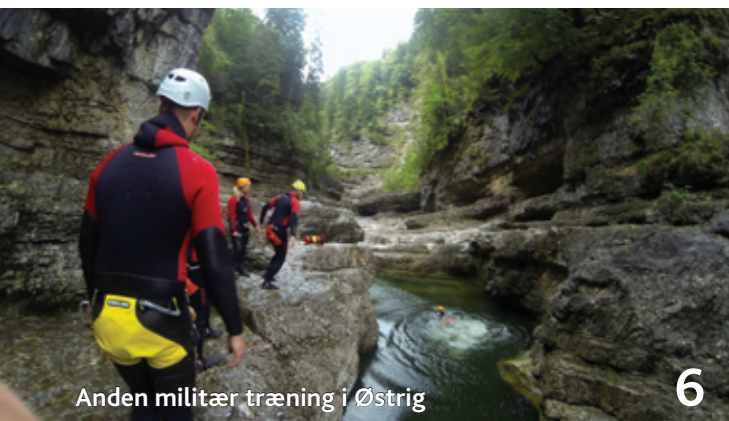
Anden militær træning i Østrig