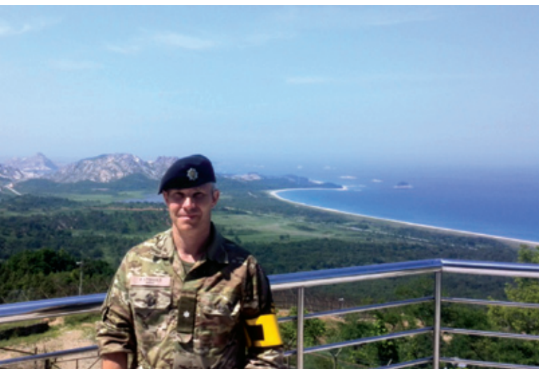
Undertegnede på besøg i den østlige transportkorridor. I baggrunden ses Nordkorea og den koreanske Stillehavskyst.

Man skal dog ikke tro, at Seoul er en tilbagestående by i den 3. verden. Seoul er en storby i rivende udvikling. Gennem de sidste 20-30 år har Sydkorea udviklet sig fra et fattigt landbrugsland til en magtfaktor i verdensøkonomien. Seoul er en by med mere end 20 mio. indbyggere og derved den næststørste i Asien. I dag ligner den på mange områder Tokyo både med hensyn til udvikling, infrastruktur og prisniveau. Priserne ude i byen er på niveau med Danmark, når man ser på mærkevarer indenfor elektronik, tøj o.l. I nogle tilfælde er tingene tilmed dyrere. Nogle ting er dog stadig billige. Kørsel i taxa og tog er billigt, og restauranterne er også noget billigere end hjemme. Og så er det en helt anden kultur, hvilket er med til at gøre opholdet spændende og lærerigt.