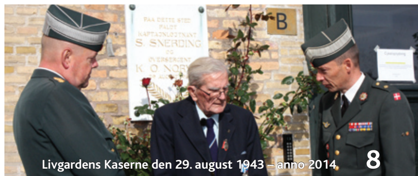
Livgardens Kaserne den 29. august 1943 – anno 2014