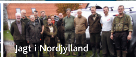
Jagt i Nordjylland