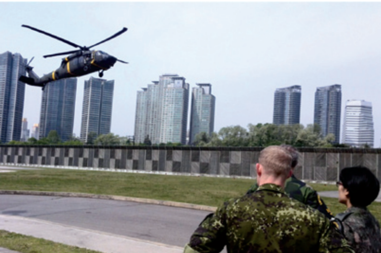
H-128 helikopteren på vej ind på landepladsen i Seoul. Herfra går turen til DMZ i forbindelse med den månedlige flyvning.

personer, når man kommer lidt væk fra basen. Når man ser sig omkring i metroen, er man ofte den eneste med vestligt udseende og på trods af den store amerikanske indflydelse gennem de sidste 60 år, så skal man ikke forvente, at man kommer langt med engelsk. Det er på sin vis overraskende, at antallet af udlændinge er så begrænset, når man tænker på landets historie.