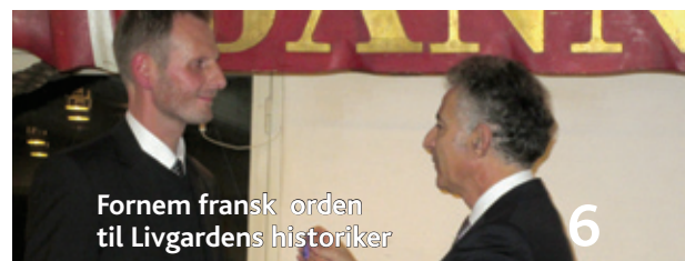
Fornem fransk orden til Livgardens historiker