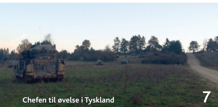
Chefen til øvelse i Tyskland