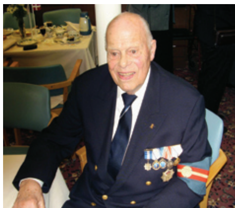
FEB-81 Kenneth Olsen