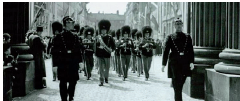
Musikkorpset og politiet 1937, Chr. X's 25 år jubilæum.