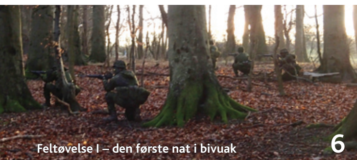
Feltøvelse I – den første nat i bivouak