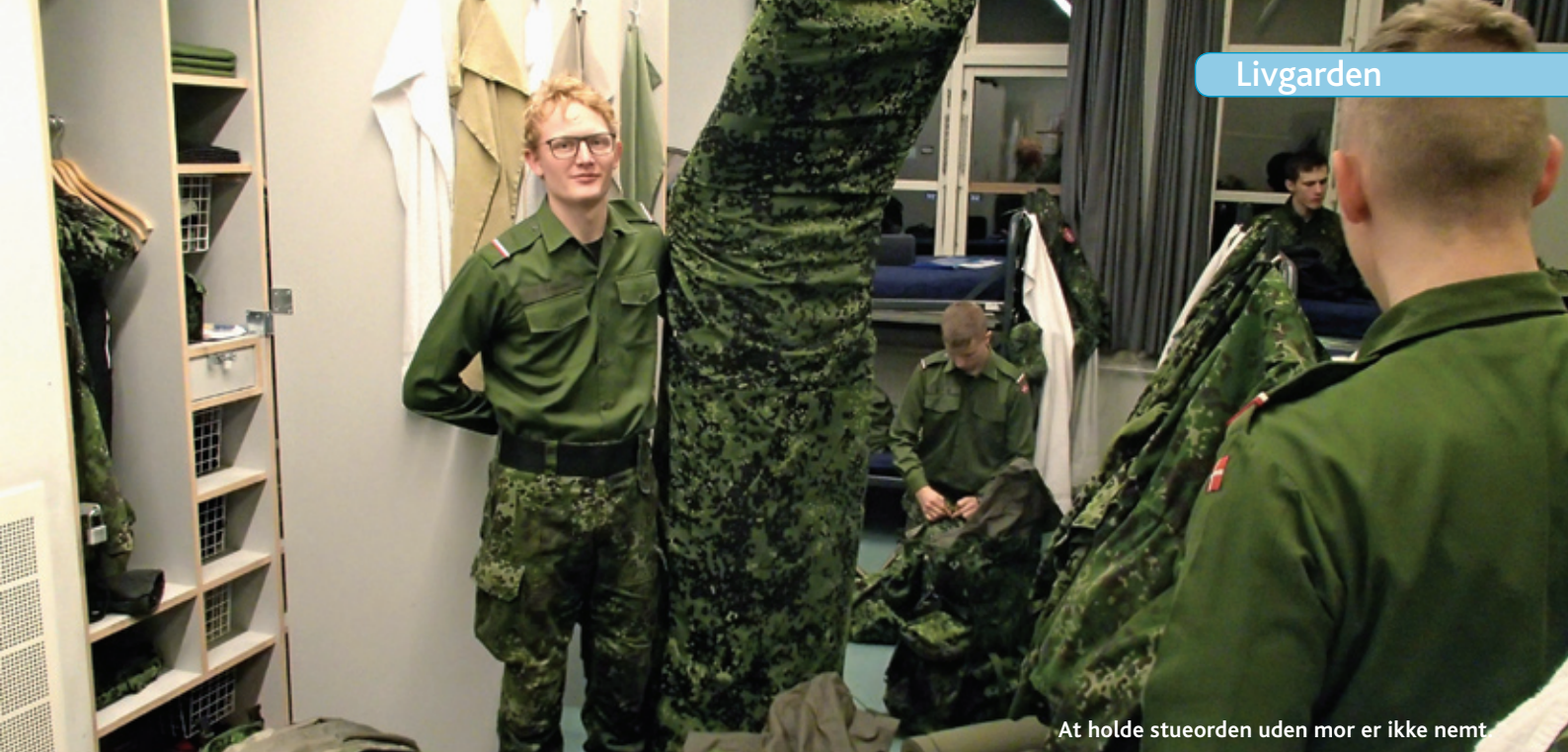
At holde stueorden uden mor er ikke nemt