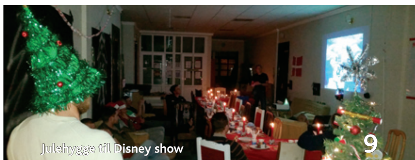
Julehygge til Disney show