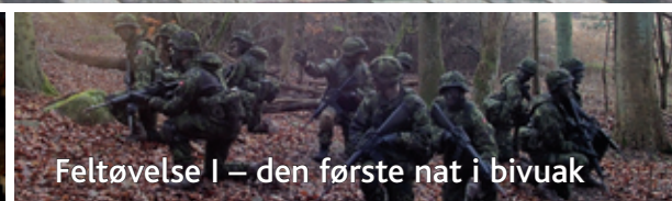
Feltøvelse I – den første nat i bivouak