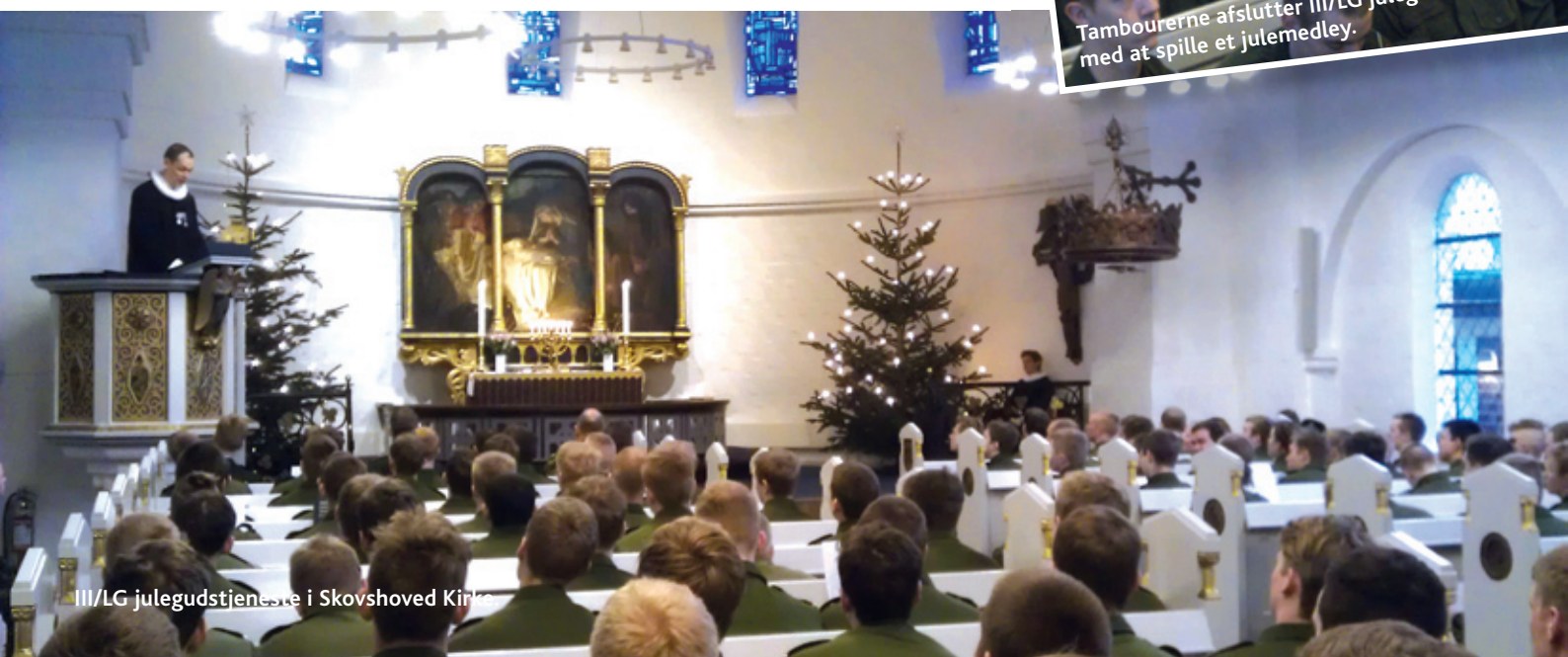
III/LG julegudstjeneste i Skovshoved Kirke