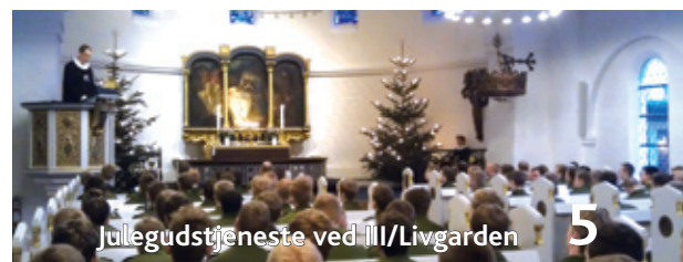
Julegudstjeneste ved III/Livgarden