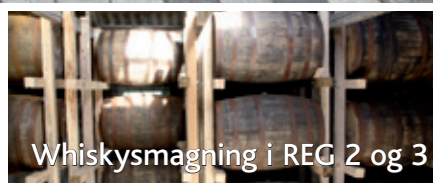
Whiskysmagning i REG 2 og 3