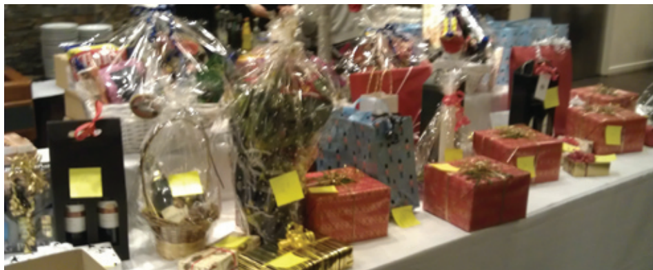
GF Nordjyllands gavebord ved Julebankospillet.

Tirsdag den 2. december 2014 havde vi vor tra- ditionelle julesammenkomst i Papegøjhaven, hvor vi spillede gavespil om ikke blot 12 dejlige ænder men også om 4 store købmandspakker, med alt hvad der hører til en hyggelig jul. Der- udover kunne vi også i år spille om alle de dejlige gaver, som firmaer og medlemmer gavmildt havde begavet Garderforeningen med. En stor tak til alle de gavmilde medlemmer og firmaer. Som noget nyt var der i år også sidegevinster til vinderbordene.