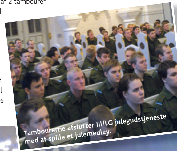
Tambourerne afslutter III/LG julegudstjeneste med at spille et julemedley.

For en militær enhed, er det en stemningsfuld tradition, at afslutte tjenesten med en julegudstjeneste op til jul. For hold DEC14 vil det være en af de oplevelser, de vil tage med fra deres soldatertid.