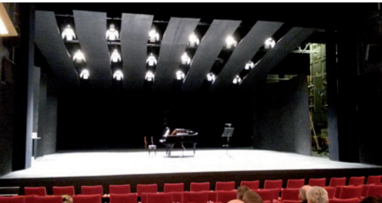
Scenen i Stærekassen, afskrækkende stor og tom, venter på konkurrencedeltagerne.

Efter hvad man må kalde overordentligt lange forhandlinger (siden 2008!), er det i slutningen af 2014 lykkedes vores fagforening CO10, Foreningen af Musikere i Forsvaret samt vores tillidsrepræsentanter og Forsvarets Personel Styrelse, at blive enige om en ny overenskomst. De allerede tjenestemandsansatte musikere forbliver ansat som sådanne, men nye kolleger ansættes efter en ny organisationsaftale. Aftalen åbner op for, at orkestret kan slå vakante stillinger op. Der har ingen nyansættelser været siden 2009, og i løbet af de år er mange kolleger gået på pension. En tredjedel af orkestrets 36 pladser varetages af kontraktansatte musikere og assistenter! At Musikkorpset har kunnet fungere så godt alligevel, skyldes dels assistenternes høje niveau, dels fleksibilitet fra ledelse og fastansatte musikere. Men det er klart, at kontinuitet er en forudsætning for seriøst orkesterarbejde på sigt. Nu er der en række stillingsopslag på vej: basbasun, horn, kornet, tuba, slagtøj, klarinet.