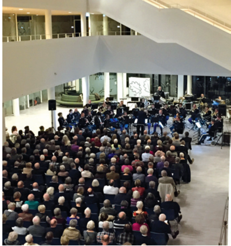
Egedal Rådhus 23/1-15.