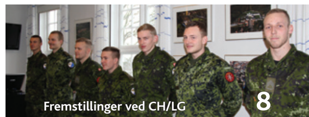
Fremstillinger ved CH/LG