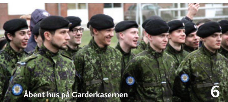
Åbent hus på Garderkasernen