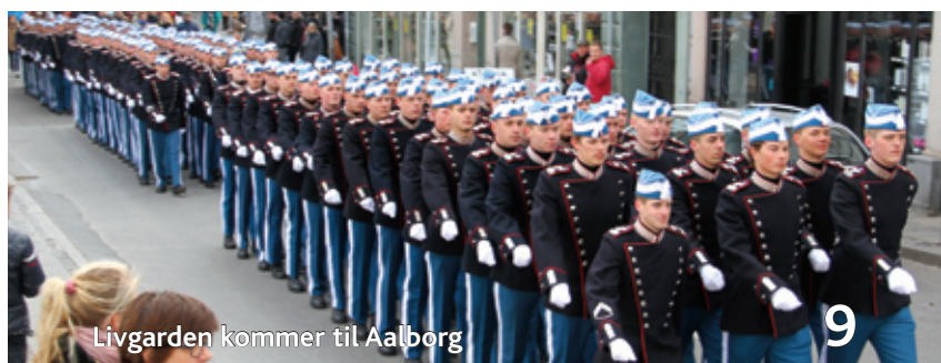
Livgarden kommer til Aalborg