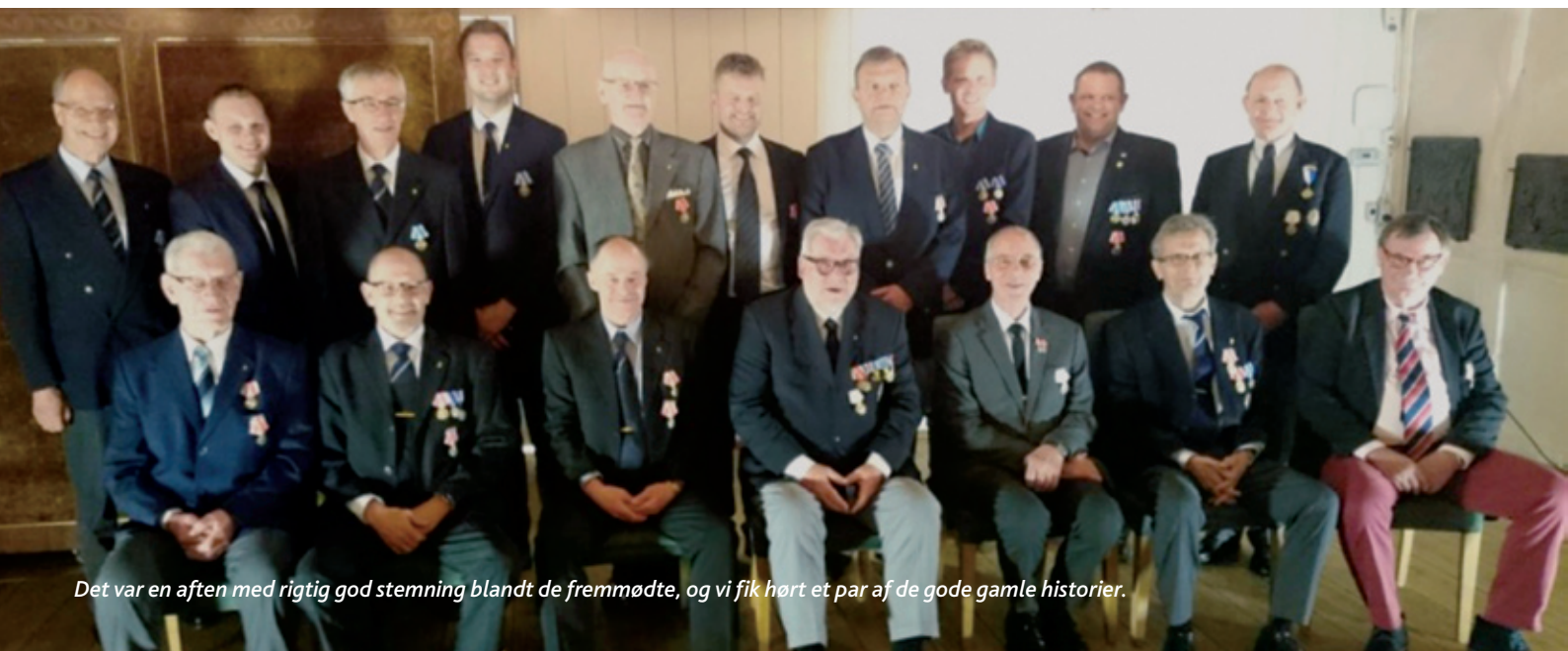
Det var en aften med rigtig god stemning blandt de fremmødte, og vi fik hørt et par af de gode gamle historier.