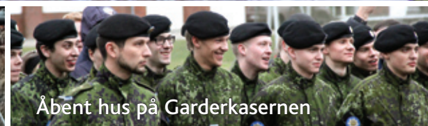
Åbent hus på Garderkasernen