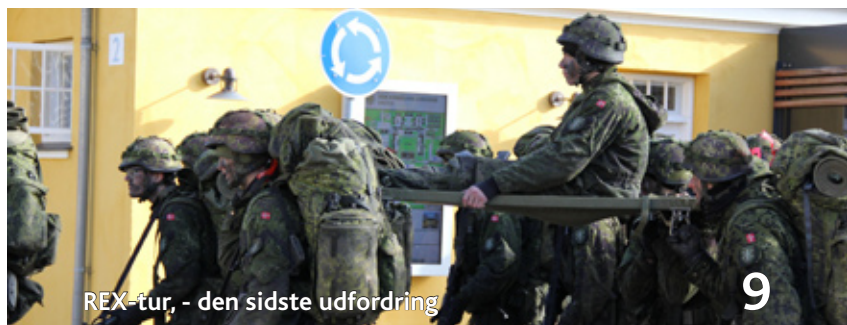
REX-tur, - den sidste udfordring