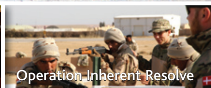
Operation Inherent Resolve