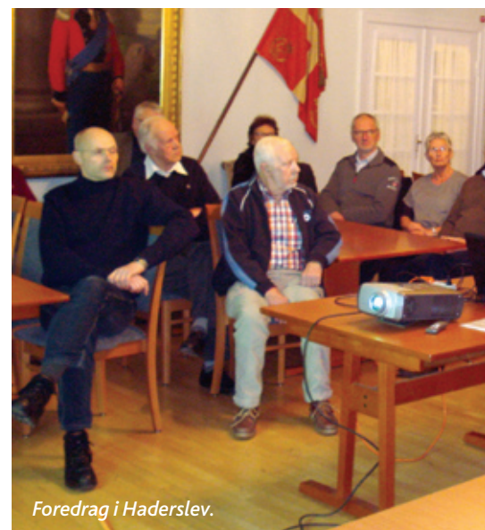
Foredrag i Haderslev.

Onsdag den 4. februar 2015 afholdt Haderslev Garderforening den årlige "Kulturfesten" i