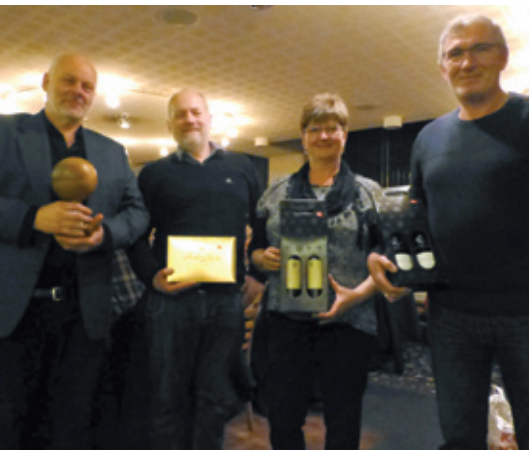
De vindende personer i bowling med præmier.