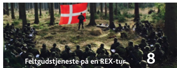
Feltgudstjeneste på en REX-tur