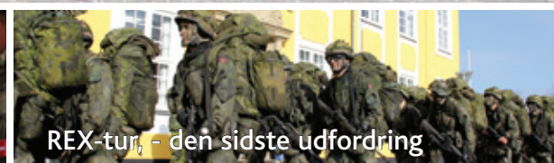
REX-tur, - den sidste udfordring