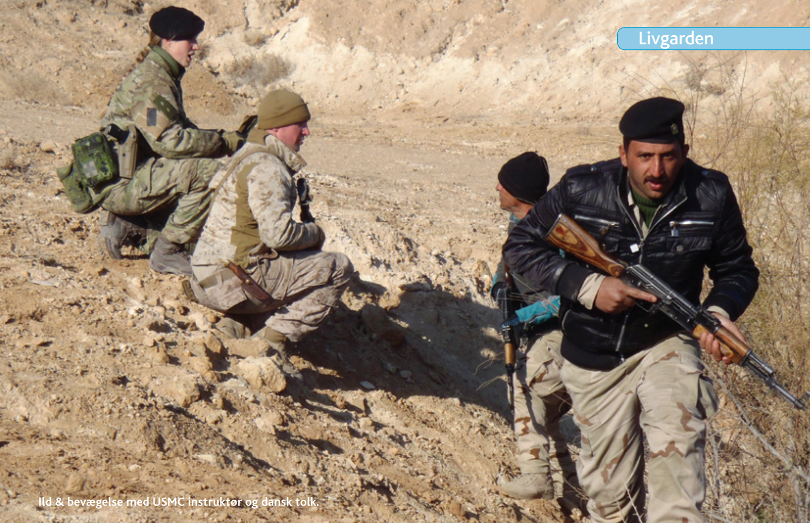
Ild & bevægelse med USMC instruktør og dansk tolk.

ankomsten i december 2014 havde lagt tyngde i at sikre basen frem for at uddanne irakere. Derfor var der ikke afsat specielt mange USMC instruktører til den opgave – og det betød naturligvis endnu større effekt af det danske bidrag, da vi dermed i løbet af januar mere end fordoblede det samlede antal instruktører. På den måde blev DANCON hurtigt værdsat og ved at stikke den berømte finger i jorden, lykkedes det at komme godt ind på livet af USMC. Også i kraft af, at rigtig mange i DANCON har været udsendt før, og gennemført lignende træning i enten Irak eller Afghanistan. Den synlige effekt af dette aftvang respekt og førte til høj grad af integration i såvel planlægning som gennemførelse af træningen.