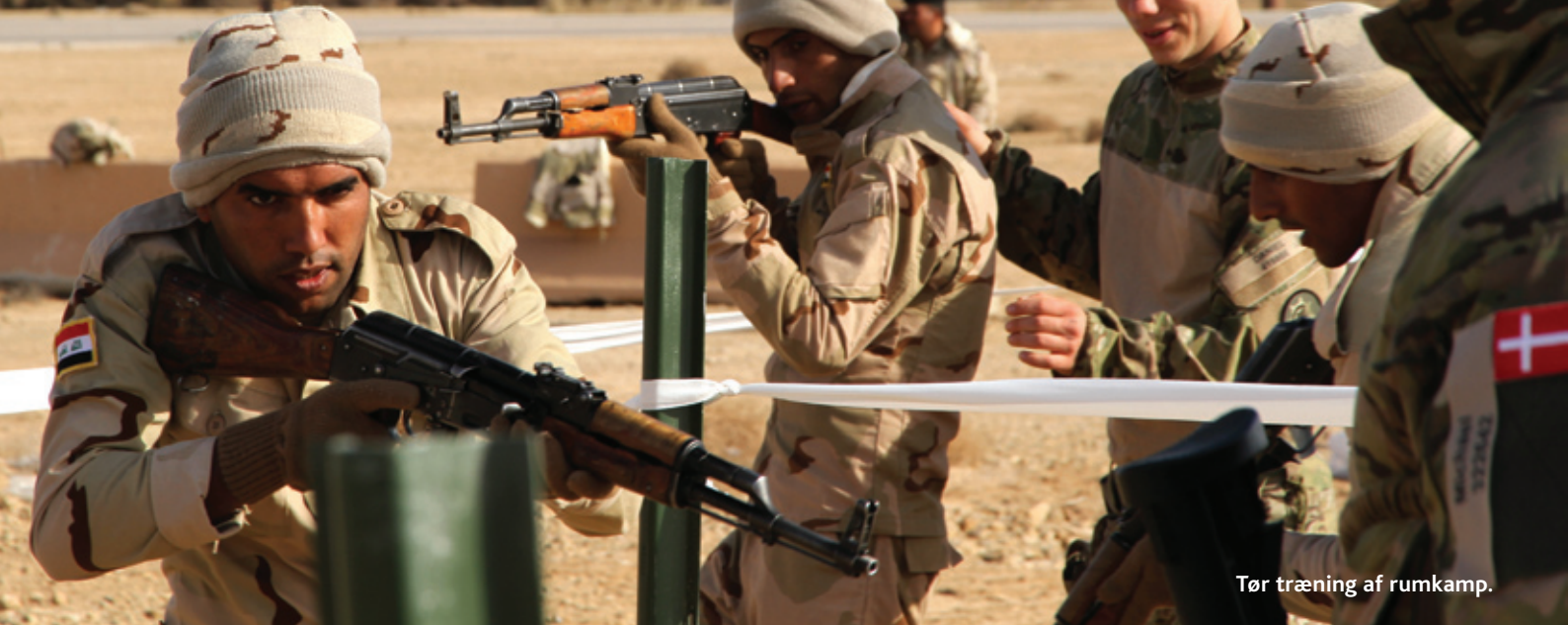
Tør træning af rumkamp.