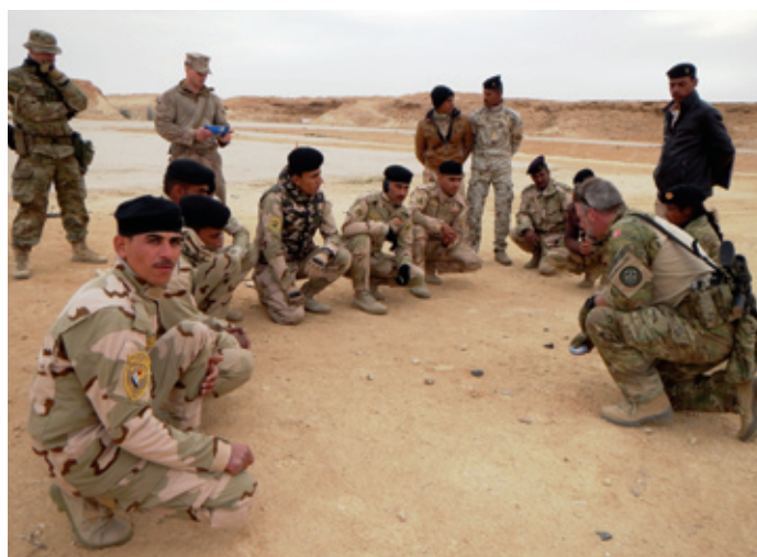
"Vise-Forklare-Øve" med danske og USMC instruktører, støttet af tolke.

Udover tolke og trænerne er der i DANCON en sikringsstyrke og en lang række personer, der tilsammen sørger for, at opgaven kan løses i det daglige, og dem skal man aldrig glemme: Uden den fornødne sikring af trænerne og lejren, uden håndtering af gods og personel, uden opretholdelse af signaltjenesten og uden den nødvendige administrative støtte, fungerer løsningen af hovedopgaven ikke. Samtidig er mange af disse mennesker gode til at skabe forhold i lejren, der gør, at man begynder at føle sig hjemme, og får lyst til at deltage i det sociale samvær. Sidstnævnte er ikke uvæsentligt, når man husker på, at store dele af DANCON primært opholder sig inden for Camp Havocs (lille) perimeter.