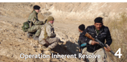
Operation Inherent Resolve