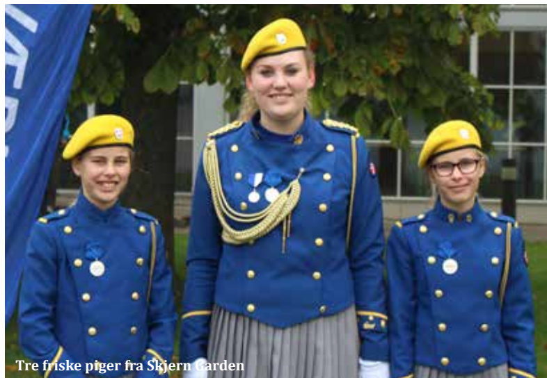
Tre friske piger fra Skjern Garden

Vi ønsker at takke Gardernetværk og Den Kongelige Livgarde for et godt samarbejde.