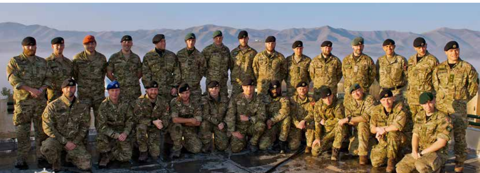
Gruppefoto af den danske delegation

Kompagniet vil afslutningsvis takke De Danske Garderforeninger for de tilsendte julegaver som alle, upågtet regiment, modtog.