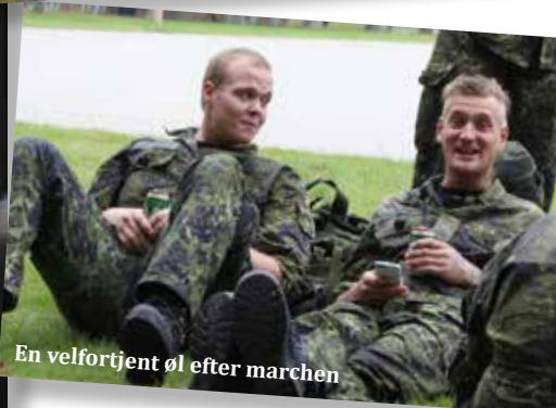
En velfortjent øl efter marchen