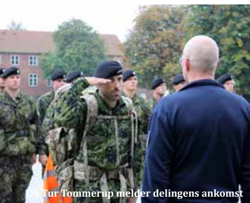
ØS Tur Tommerup melder delingens ankomst