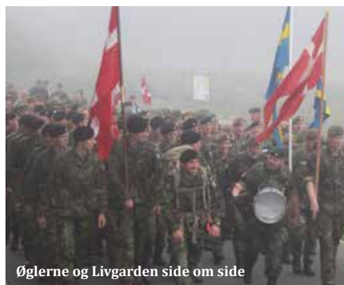
Øglerne og Livgarden side om side