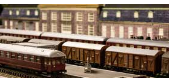
Odense Model Jernbane Klub.