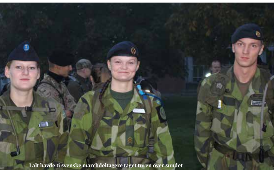
I alt havde ti svenske marchdeltagere taget turen over sundet