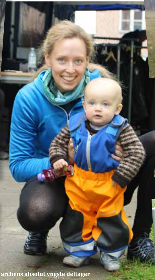
Marchens absolut yngste deltager