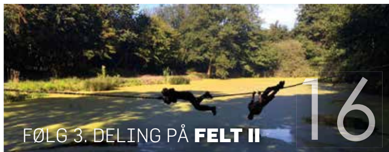
FØLG 3. DELING PÅ FELT II