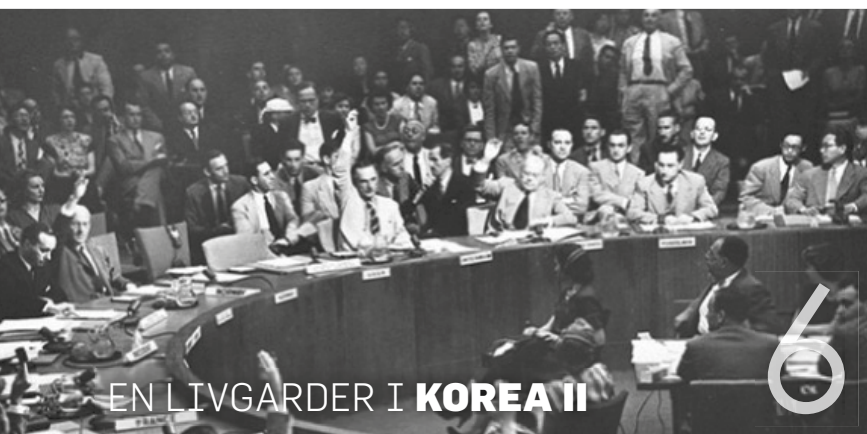
EN LIVGARDER I KOREA II