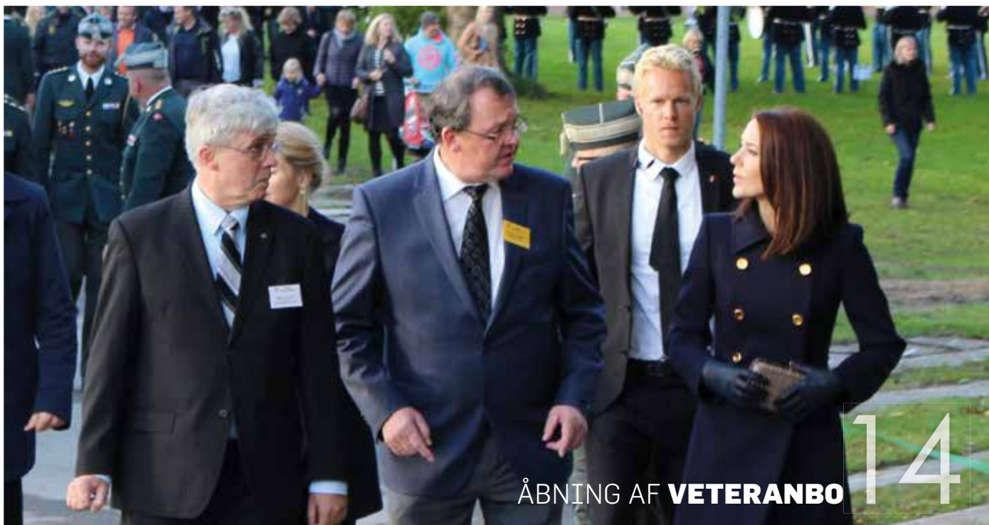
ÅBNING AF VETERANBO