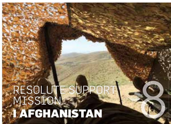
RESOLUTE SUPPORT MISSION I AFGHANISTAN