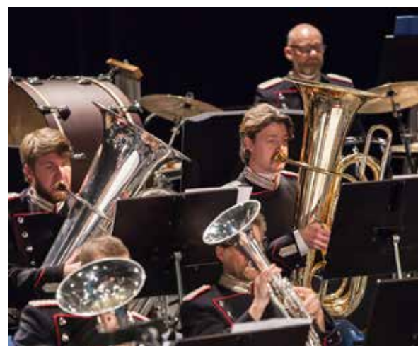
Koncert 18.12.15.

Musikkorpset plejer at lade overskuddet af en julekoncert gå til velgørende formål, og denne gang var en hel forening rykket ind i Stærekassen til koncert den 18. december: foreningen Bryd Tavsheden, der på frivillig basis hjælper børn og unge, der lever med vold i hjemmet. Billetterne solgtes til fordel for Bryd Tavsheden, og alle kunstnere optrådte gratis. Kunstnerne var ikke hvem som helst: Dirigenten Michael Bojesen, Michael Bojesens Pigechor, sangerne Birthe Kjær og Bobo Moreno samt pianist og komponist Bent Fabricius Bjerre. Pigechoret sang engleskønt, evig-unge Birthe Kjær var god, Bobo Moreno charmerende, og endelig fik vi alle lov at fælde en lille tåre over Bent Fabricius Bjerre, der spillede sit tema til Matador på flygelet. Julestemningen var i hus.