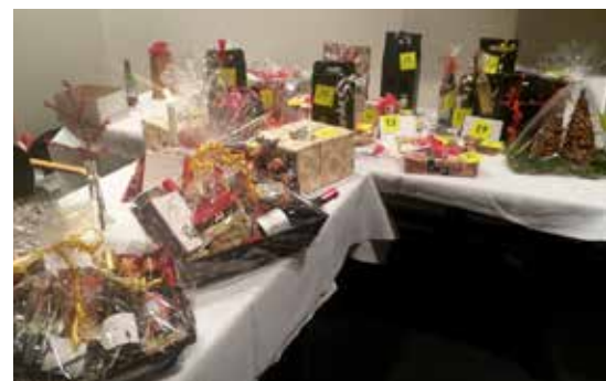
GF Nordjyllands gavebord ved Julebankospillet.

Tirsdag den 8. december 2015 havde vi vor traditionelle julesammenkomst i Papegøjehaven, hvor vi spillede gavespil om ikke blot 12 dejlige ænder men også om 4 store købmandspakker, med alt hvad der hører til en hyggelig jul. Derudover kunne vi også i år spille om alle de dejlige gaver, som vore