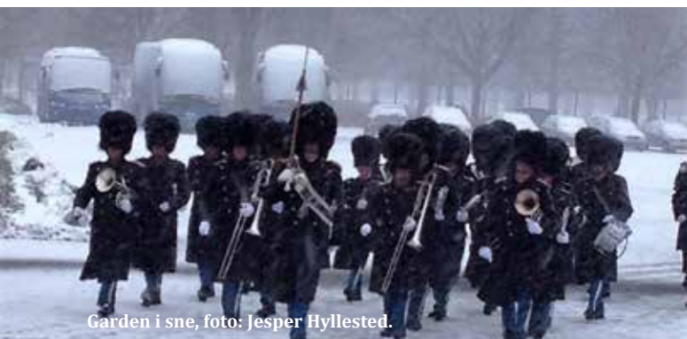
Garden i sne, foto: Jesper Hyllested.

Der er stadig langt mellem de københavnske vagtparader, idet H.M. Dronningen bor på Fredensborg Slot under reoveringen af Amalienborg. Men ca. hver onsdag er der alligevel vagtparade med musik i København, og ca. hver torsdag i Fredensborg. Følg med i kalenderen på www.livgardensmusikkorps.dk . Et par gange i den kolde januar var der frostmarch, dvs. Musikkorpset gik turen, men uden at spille, idet ventiler og klapper på instrumenterne simpelt hen var frosset fast, så man ikke kunne skifte tone. Heldigvis var det kun få gange, for det er meget sjovere at spille på turen, end ikke at spille! Den milde vinter er generelt god ved os.