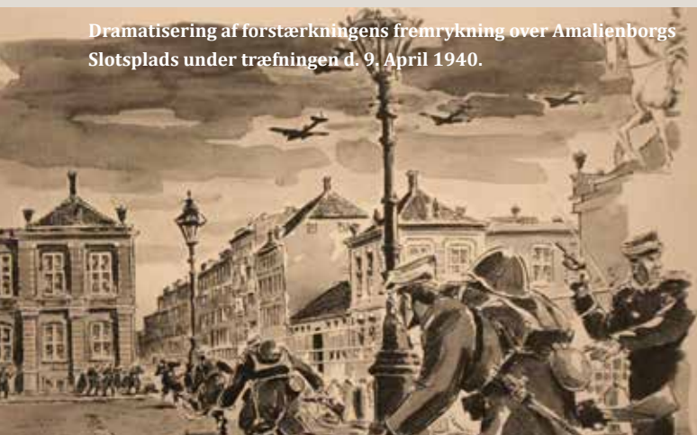
Dramatisering af forstærkningens fremrykning over Amalienborgs Slotsplads under træfningen d. 9. April 1940.