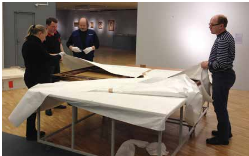
Maleriet pakkes ned i Moskva - og pakkes ud efter modtagelse ved Livgarden.

kan det desuden nævnes, at maleriet sammen med et større maleri af Frederik 9. indgår som baggrund i det maleri af Hendes Majestæt Dronningen, som blev skænket af Rusland i 1993, i anledning af 500 året for de dansk-russiske diplomatiske forbindelser.