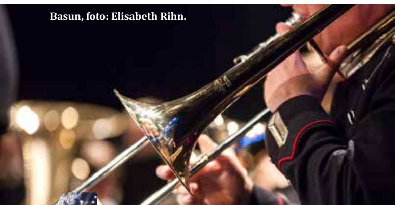
Basun, foto: Elisabeth Rihh.