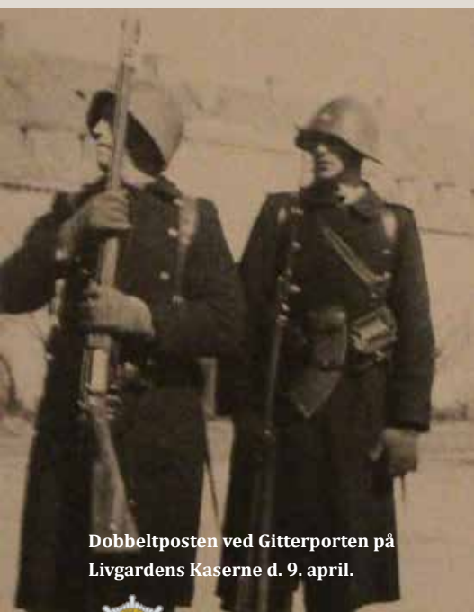
Dobbeltposten ved Gitterporten på Livgardens Kaserne d. 9. april.