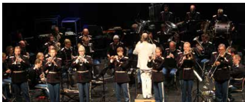
Musikkorpset havde for nylig fat i amerikansk musik ved en Sousa-koncert i Skanderborg ved Repræsentationsmødet. ”Stars & Stripes” blev gentaget på den amerikanske ambassade.

Desuden har Musikkorpset medvirket ved Gardens Dag i Høvelte, ved æreskommandoen i anledning af den polske præsidents besøg samt ved et stort havearrangement hos den amerikanske ambassadør. Fredag før sommerferien spillede vi ved såvel årsdagsparaden som en udsendelsesparade, inden der om aftenen blev spillet både klassisk Lanciers og dansemusik v/ Livgardens Danceband ved Livgardens årsdagsmiddag. På godt og sommerligt gensyn til alle!