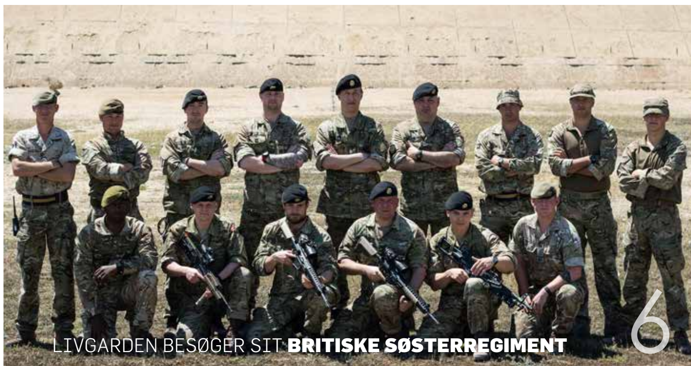
LIVGARDEN BESØGER SIT BRITISKE SØSTERREGIMENT