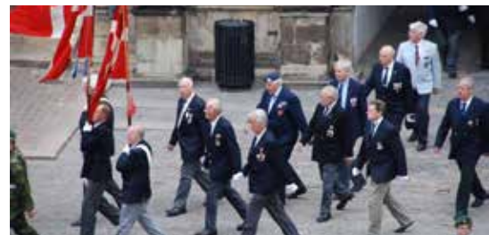
Indmarch i slotsgården på Kronborg ved Forsvarets Dag.