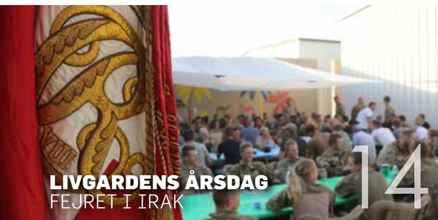
LIVGARDENS ÅRS DAG FEJRET I IRAK