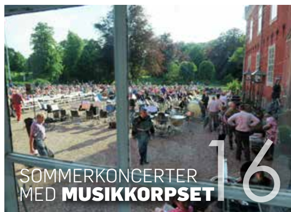
SOMMERKONCERTER MED MUSIKKORPSET