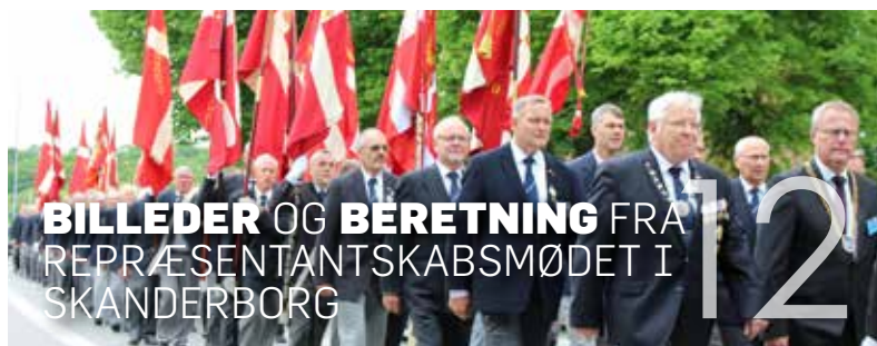
BILLEDER OG BERETNING FRA REPRÆSENTANTSKABSMØDET I SKANDERBORG